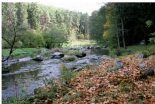
Údolí řeky Oslavy.