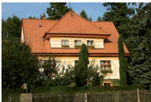
Vila Jakuba Demla.